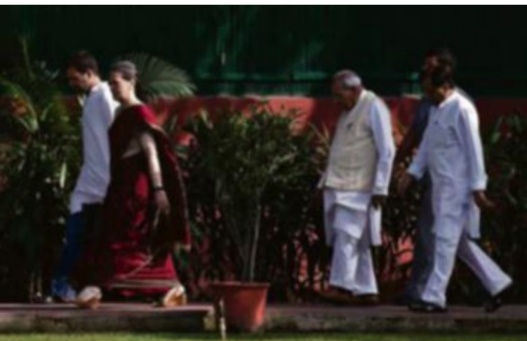
TAPTE: 19. mai måtte statsministerkandidat Rahul Gandhi (t.v.) og Kongresspartiets president Sonia Gandhi møte for arbeidskomiteen i New Delhi, etter å ha tapt 162 av 206 plasser i parlamentet. Her fulgt av seniorpartifellene Moti Lal Vohra og Ahmad Patel (t.h.). Mor og sønn tilbød seg å trekke seg fra å lede partiet, men de ble mandag bedt om å fortsette.

Mot Kongresspartiet? Valgkampen var de siste månedene sterkt dominert av Narendra Modi, statsviteren og den tidligere førsteministeren i den nordøstlige Gujarat-staten. Det har vært plakater av ham alle steder, han har vært i alle medier, og han har kommunisert en klar visjon om økonomisk vekst. Mange ser derfor dette som en personlig valgseier for Modi.