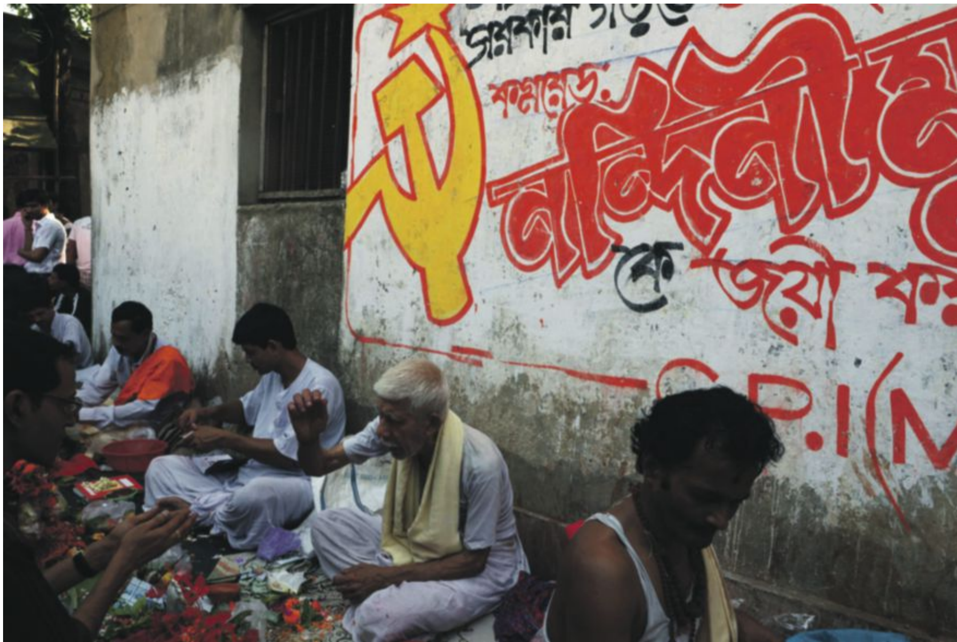
VEGGMALERI: Handelsmenn i Kolkata 15. april, foran et veggmaleri med støtte til Communist Party of India (Maoist).

portretteres den indiske staten som en tyrann uten legitimitet som må avskaffes gjennom «langvarig folkekrig».